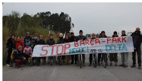
Pancarta d'STOP al Barça Park

Segurament, apostar per fer servir el litoral per l'oci ciutadà dóna rendiments electorals, però ha de ser el sentit comú el que ens ha de fer veure, que si volem un passeig marítim ple de gent i restaurants, ho trobem a Gavà o a Castelldefels. A Viladecans, cal apostar per l'oci cultural, educatiu i ecològic, on escolars, ciutadans i famílies, poguem gaudir de la natura, apropant-nos amb transport públic i bicicletes. Només així, ajudarem a la maledicció: preservar el nostre patrimoni natural. ■