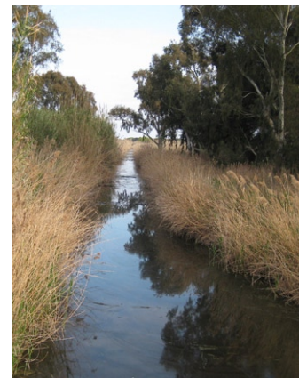
Corredora de separació entre xarxa natura 2000 i Barça Parc

Però no cal preocupar-se, els qui governen Viladecans continuaran intentant-ho. Mentrestant, cal donar gràcies que la dificultat per accedir al litoral de Viladecans ha permès que qui feia l'esforç d'anar-hi pogués gaudir d'una platja gairebé verge, d'un espai natural d'alt nivell i d'una reserva natural prou ben gestionada.